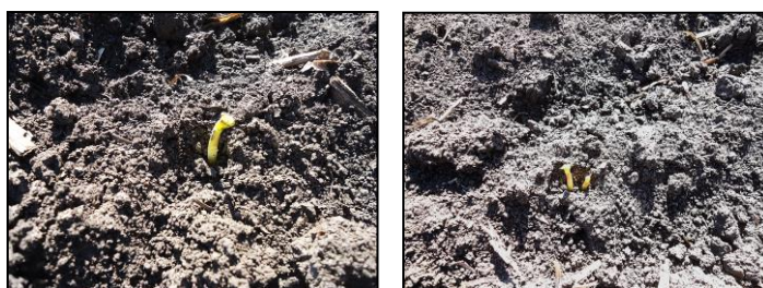
Рис. 1 – Повреждение всходов подсолнечника птицами, 2-е отделение ФГБУ ФНЦ ВНИИМК, х. Октябрьский (ориг.), 2023 г.

В Краснодарском крае грачи и другие врановые, начиная с весеннего периода, выклеивают из земли только что посеянные семена подсолнечника, сои, а чуть позже повреждают проростки этих культур, выдергивая их либо откусывая появившиеся семядоли (рис. 1).